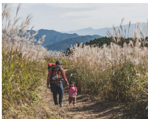
作品名 はじめてのススキ 撮影場所 岩湧山 氏名 杉田 綜平