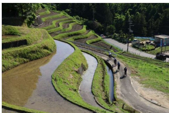
作品名 棚田の通学路 撮影場所 東阪 氏名 山口 茂