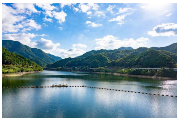
作品名 秋陽映える湖 撮影場所 滝畑ダム