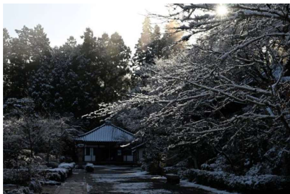
作品名 初雪氷結 撮影場所 延命寺 氏名 東 文男