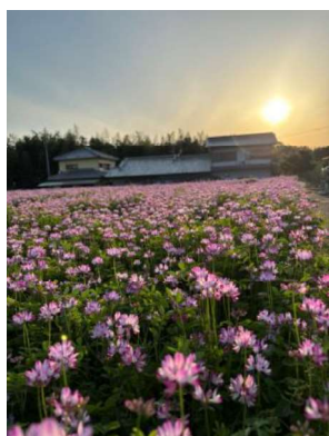
作品名 夕日と蓮華 撮影場所 水分 氏名 仲野 隆之