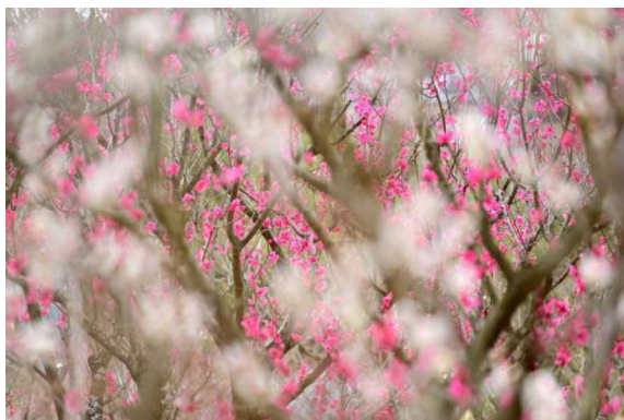
作品名 紅梅白梅 撮影場所 大阪府立 花の文化園 氏名 竹村 三恵